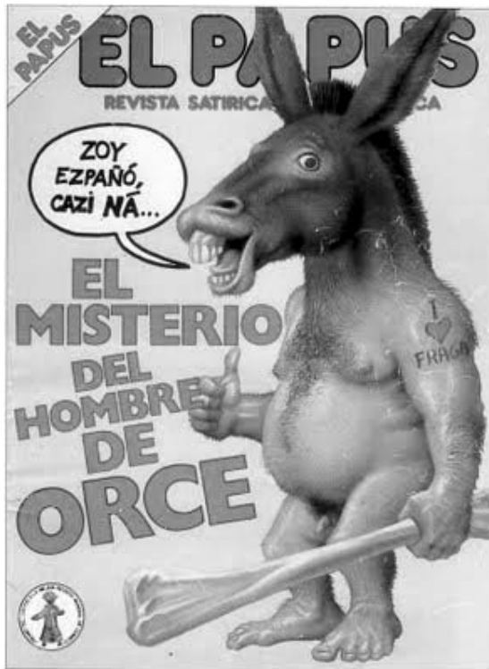
Figura 2. Portada de la revista satírica El Papius de junio de 1984 en plena polémica pública.

La forma en que estalló la controversia visibiliza las dos caras de la relación entre los científicos catalanes, conscientes de que procedían de un país «retrasado» en ciencia y los científicos franceses, de gran prestigio 18 .