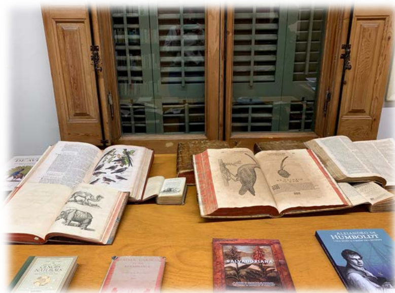
Fotografia 2. Petita exposició a la Biblioteca del Museu de Granollers dels diversos exemplars relacionats amb la xerrada entre els que es trobaven els Ornithologie, d'Ulisse Aldrovandi i Historia Naturalis de Avibus, de Johannes Jonstonus.

En aquesta època, els intercanvis de cartes, gravats, dibuixos, tractats, plantes... eren molt freqüents. Jonstonus copiava i feia circular gravats d'Aldrovandi, recollia històries i llegendes com les aus del paradís, l'au fènix, etc. ja que aquests simbolismes formaven part d'aquesta ciència natural. De fet, aquest intercanvi era l'única manera de comunicar-se entre humanistes, cirurgians, clergat, naturalistes... homes amb diners i propis de l'època. És així com comença el col·leccionisme d'objectes eclèctic i el coneixement esotèric o privat, que constituïen anomenats també els gabinets de curiositats.