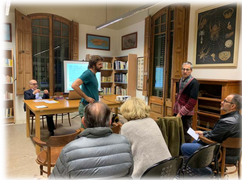
Fotografia 4. Clausura de l'acte.

El "leitmotiv" de moltes de les xerrades dutes a terme per la Societat Catalana d'Història de la Ciència i Tècnica plantegen totes aquestes preguntes perquè es reflexioni i dialogui intentant establir un coneixement en comú i d'aquesta manera poder actuar cooperativament.