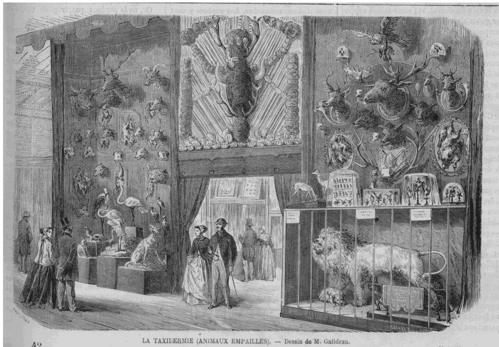
Imatge 1. Exposició Universal de París de 1867 on es veu l'entrada a la classe 42 dedicada a la caça, la pesca i les collites.